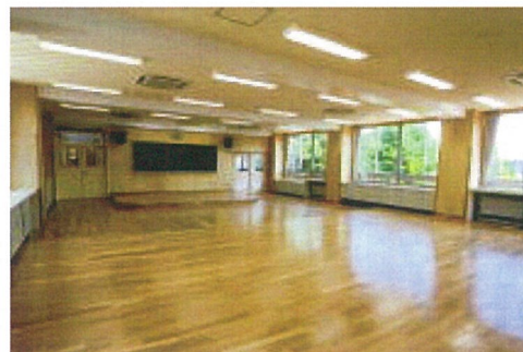
音 樂 室