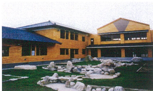
校舎外観 (中庭より)