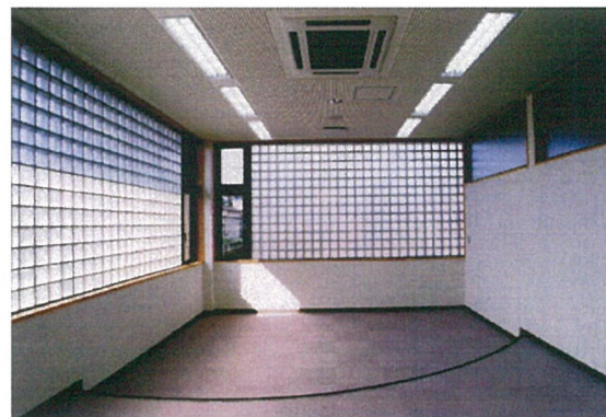
児 童 閱 覧 室