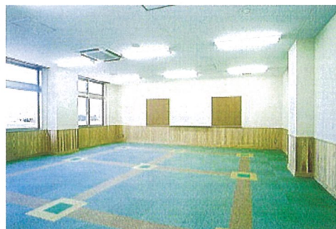
ミーティングルーム