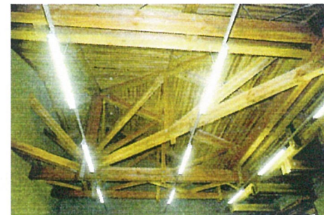
多目的ルーム（合掌）