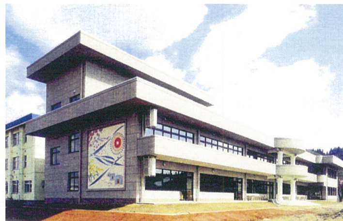
外 観 ( 南 西 側 )