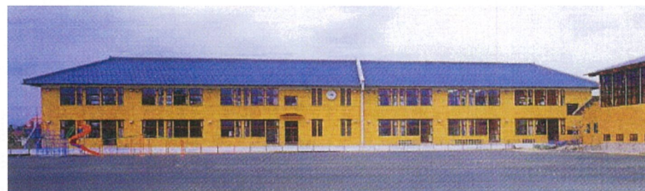
校舎外観 (グラウンドより)