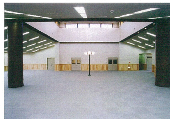
図 書 閱 覧 室