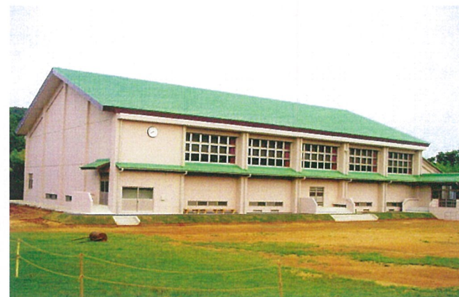
外 観 ( 全 景 )