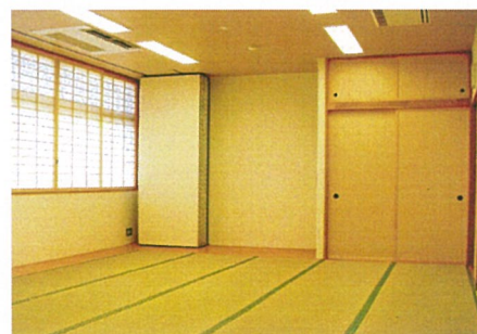
ミーティングルーム