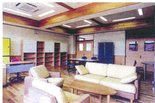
カウンスリングルーム