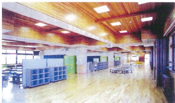
多目的教室から普通教室

発 注 者 川 口 町 施 設 概 要 小 学 校 ( 普 通 教 室 棟 ) 延 床 面 積 1,808.36 m 2 構 造 規 模 R C 造 地 上 3 階