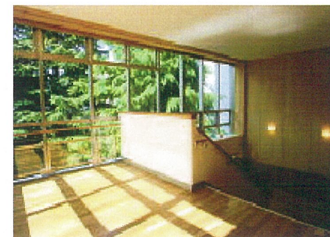
階 段 室