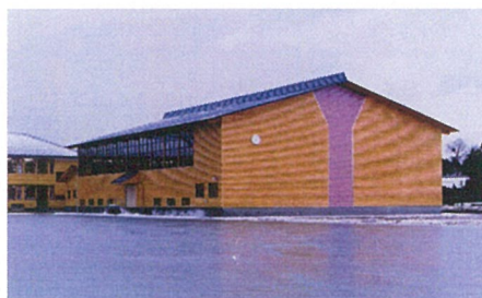
体 育 館