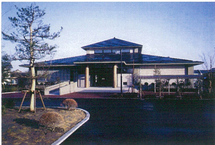
正 面 外 観

発 注 者 月瀉村（現新潟市） 施設概要 図 書 館 延床面積 6 8 9 . 9 m 2 構造規模 R C 造 地 上 1 階