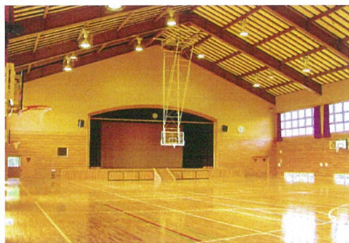
ア リ ー ナ

発 注 者 佐 渡 市 施 設 概 要 屋 内 運 動 場 延 床 面 積 1,179.18 m 2 構 造 規 模 R C 造 地 上 1 階