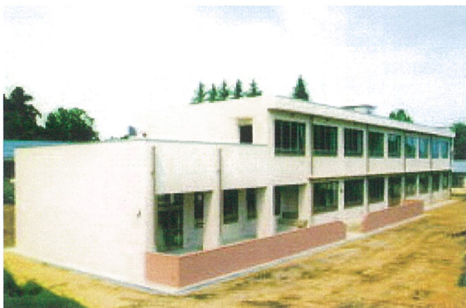
校 舍 外 觀

発 注 者 長 岡 市 施 設 概 要 中 学 校 ( 震 災 復 興 事 業 ) 延 床 面 積 1, 2 0 1 . 2 7 m 2 構 造 規 模 R C 造 地 上 2 階