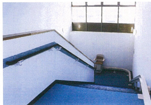
階 段 室