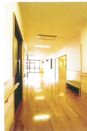
廊下から交流スペースを臨む