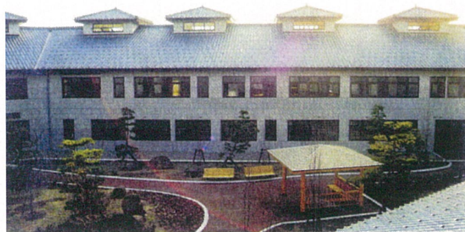
外 観(北側:中庭から)