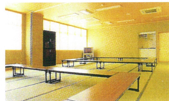
健康指導室・視聴覚室