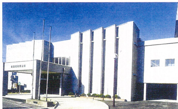
外観（町民(市民)会館東北側）