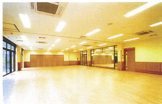
健康増進スタジオ～運動指導相談室