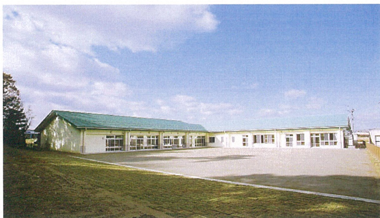
外 観 (全 景)