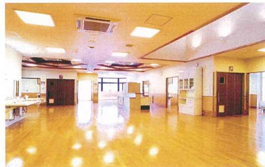
各ユニット 食堂・談話ホール