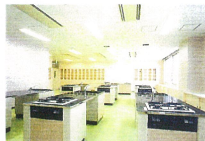
町民(市民)会館－栄養指導室