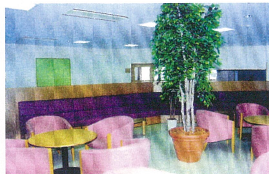
1 階 ホール