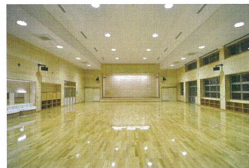
遊 戯 室