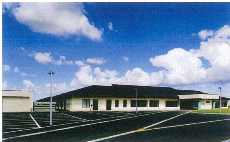
外 観(全 景)

発注者 社会福祉法人 中蒲原福祉会 施設概要 特別養護老人ホーム 50床 ショートステイ 20床 デイサービスセンター (B型) 延床面積 3,302.622 m 2 構造規模 S造 地上1階