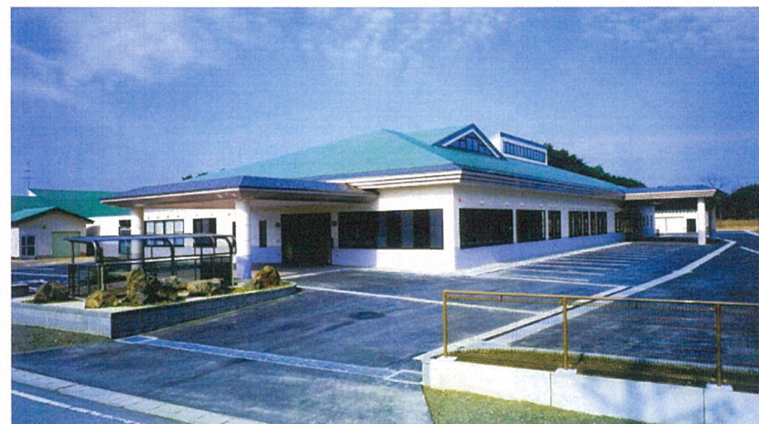
外 観（ 全 景 ）