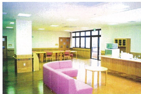
各ユニットの内観