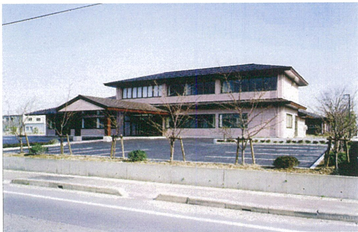
外 観 全 景

発注者 横越町（現新潟市） 施設概要 保健福祉センター・在宅介護支援センター 延床面積 952.09 m 2 構造規模 S 造 地上 2 階