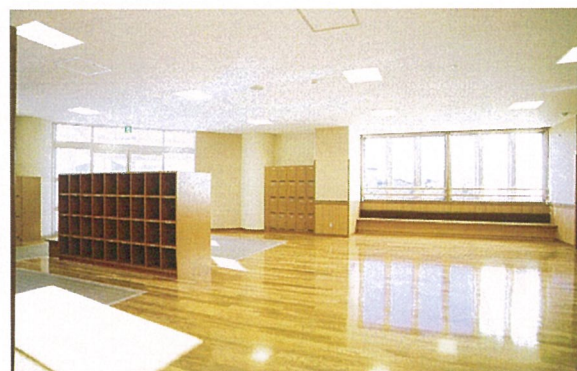
内 観 (玄 関 ホール)