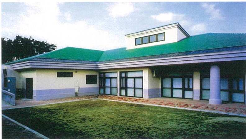
外 観（南 側）