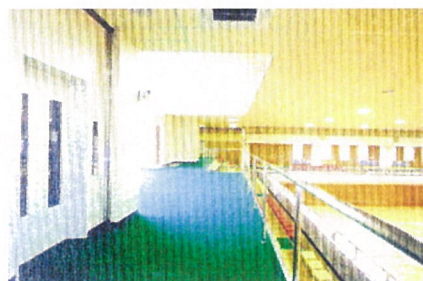
大ホール（車椅子専用観覧席）