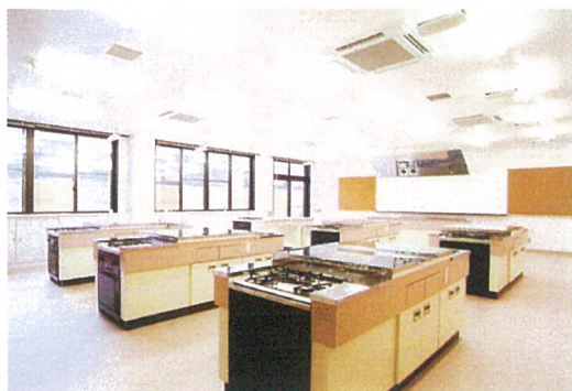
栄養指導調理実習室

発注者 紫雲寺町（現新発田市） 施設概要 総合保健施設・健康プラザ 延床面積 1,417.5 m 2 構造規模 S 造 地上 1 階