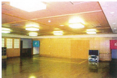
余熱利用した温泉施設：地域交流スペース