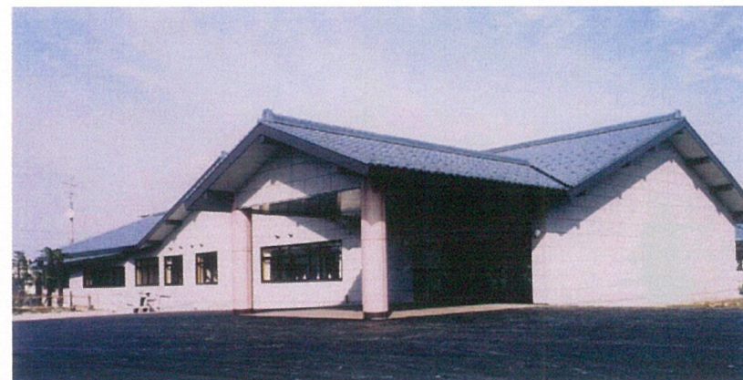
正 面 外 観