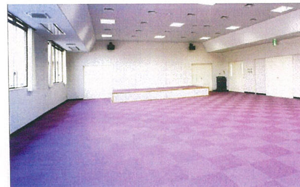
集 団 研 修 室