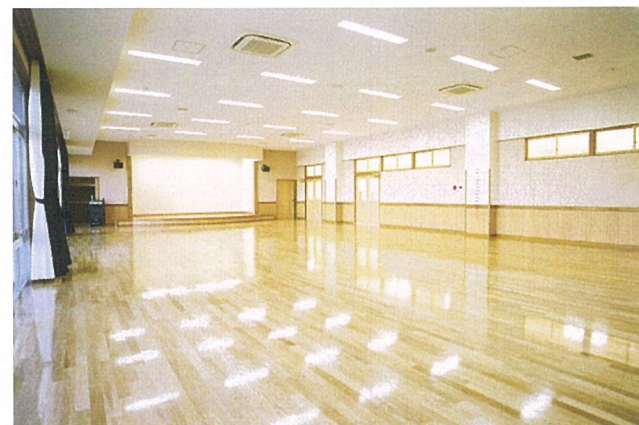
内 観 (屋 内 遊 戯 室)