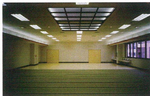
研 修 室