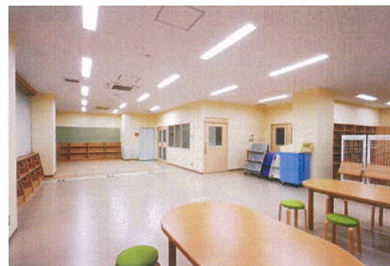
図 書 室