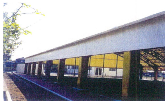
外 観（南 側）