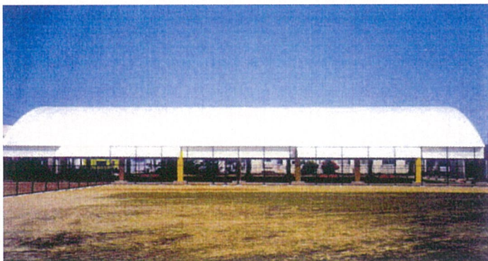
外 観（東 側）