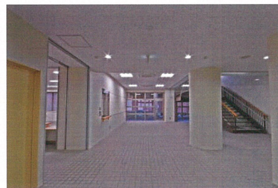
ホ ー ル