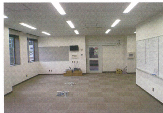
事 務 室