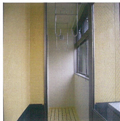
ベランダ・サンルーフ