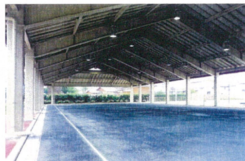
内 観（北面から南面へ）