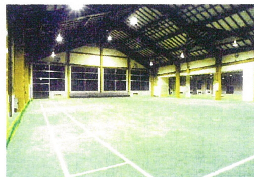
内 観 ( 南 面 )