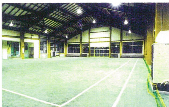
内 観 ( 北 面 )