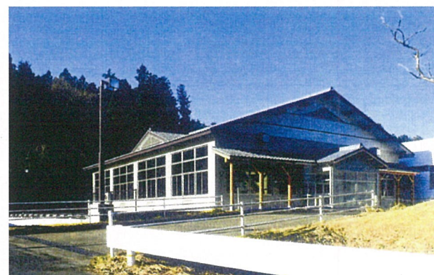
外 観 ( 東 側 )

発 注 者 出 雲 崎 町 施 設 概 要 ゲートボールコート 延 床 面 積 5 7 0 . 0 0 m 2 構 造 規 模 S 造 地 上 1 階