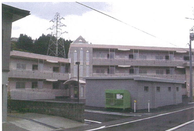
外 観（西側：住民用車庫より望む）

発 注 者 川口町（現長岡市） 施 設 概 要 共 同 住 宅（震災復興事業） 延 床 面 積 1, 0 9 1. 0 3 m 2 構 造 規 模 R C 造 地 上 3 階